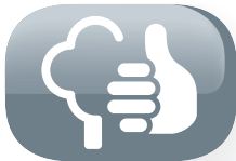
Respetuoso del medio ambiente